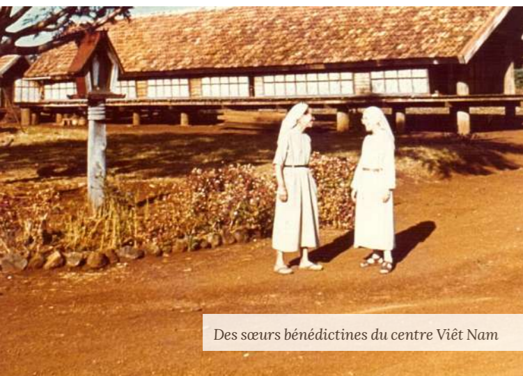
Des sœurs bénédictines du centre Viêt Nam