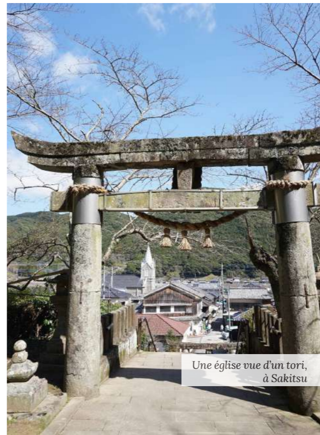
Une église vue d'un tori, à Sakitsu