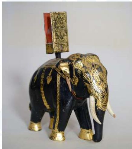
Éléphant portant sur son dos une image de Bouddha Bois laqué et doré, vers 1950.

Établies dès l'arrivée de Pierre Lambert de La Motte (1624-1679) ou de François Pallu (1626-1684), les institutions caritatives (écoles, lycées, universités, pensionnats, dispensaires, hôpitaux, etc.) sont ouvertes, sans distinction, à toute la population, apportant une contribution toujours grandissante et non négligeable à l'essor et au rayonnement de ce pays.