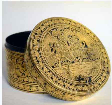
Boîte à bétel, artisanat thaïlandais. Première moitié du XX e siècle.