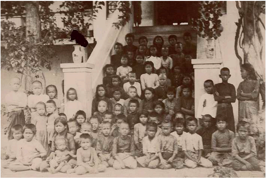
L'orphelinat de la paroisse chinoise de Bangkok, vers 1900.

Aux yeux des premiers missionnaires, le soin des malades apparaissait aussi une activité des plus apostoliques. Dès 1667, Pierre Lambert de La Motte, a envisagé la création d'un hôpital qui pourrait être géré par deux personnes zélées pour le service des pauvres et qui entendaient quelque chose de la chirurgie et de la médecine.