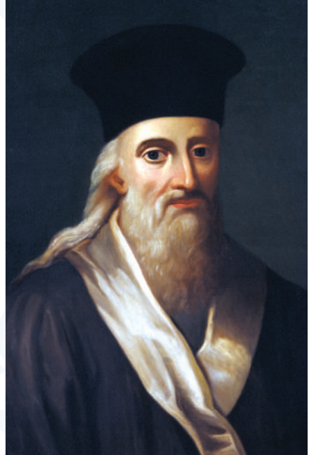
Portrait d'Alexandre de Rhodes.

Né en 1591 en Avignon, le jésuite Alexandre de Rhodes est envoyé en Cochinchine. Impressionnés par ses talents linguistiques, ses supérieurs lui confient la charge de fonder la mission du Tonkin, où en l'espace de trois ans,