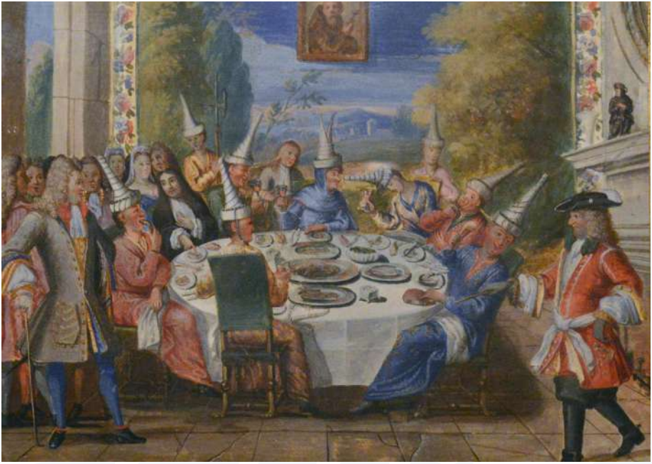
Réception des ambassadeurs siamois aux Missions étrangères de Paris, décembre 1686.

s'embarque sur deux vaisseaux de quatrième rang, Le Gaillard et L'Oiseau accompagnés de trois flûtes, La Loire, Le Dromadaire et Le Normandie. Le Siam est atteint le 27 septembre. Le 3 janvier 1688, profitant du retour des bâtiments français vers leur patrie, le roi de Siam dépêche une troisième ambassade auprès de Louis XIV, conduite par le P. Tachard, jésuite, dont les objectifs temporels sont à l'opposé de l'esprit missionnaire des vicaires apostoliques.