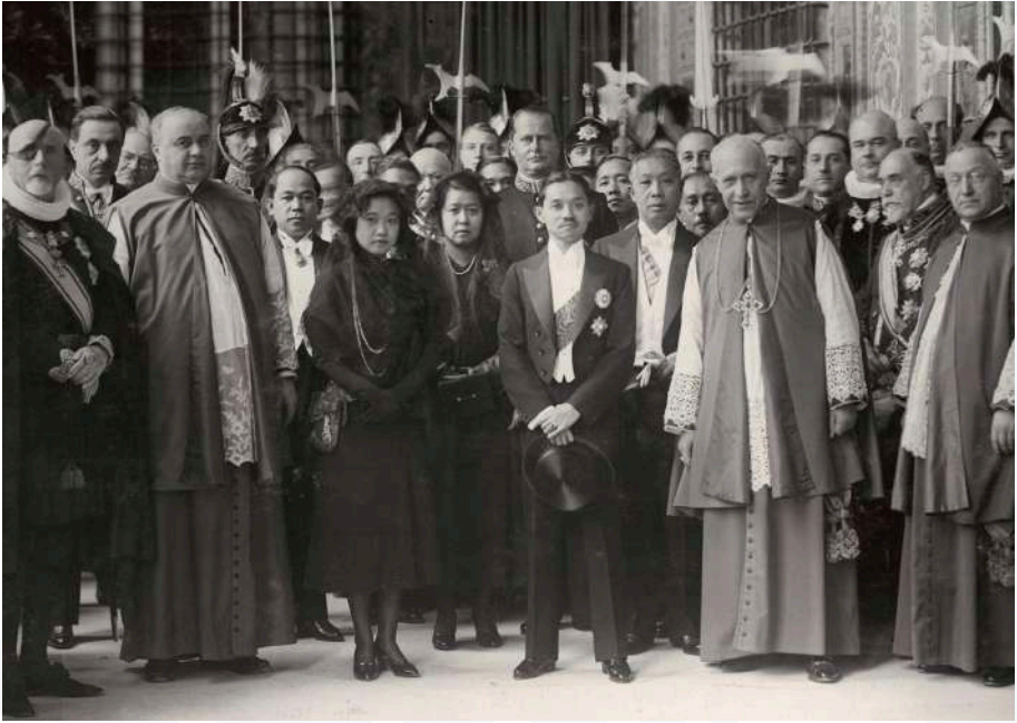
Visite à Rome du roi Rama VII, 5 juin 1897.

Louis XIV. Hélas, ces relations privilégiées se termineront par un cuisant échec et un coup d'État en 1688.