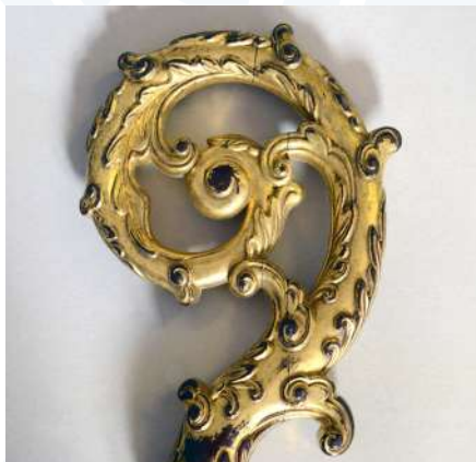
Crosse épiscopale ayant appartenu à un vicaire apostolique.

En 1782, Rama I er fonde l'actuelle dynastie régnante et offre à Mgr Coudé de revenir à Bangkok. Deux prélats édifiants, Mgr Esprit-Marie-Joseph Florens et Mgr Armand-Antoine Garnault marquent l'histoire de l'Église thaïlandaise aux XVIII e et XIX e siècles.