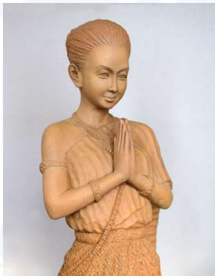
Allégorie de la Foi. École thaïlandaise contemporaine.

De leur côté, les sœurs de Saint-Paul de Chartres, fondées en 1696 à