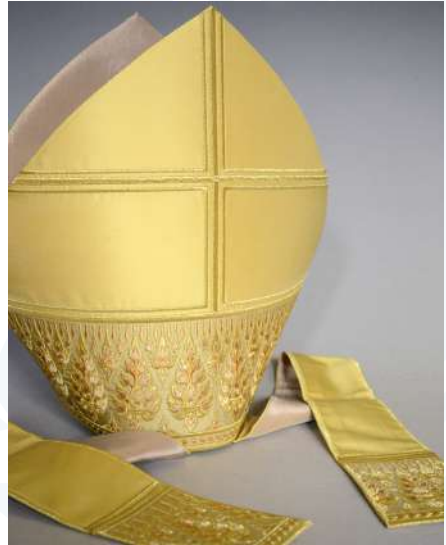
La mitre portée par le pape François lors de son voyage en Thaïlande.

Tout autant intrigué qu'intéressé par les connaissances déployées par les nouveaux missionnaires partis de Paris et arrivés dans son royaume en 1662, le roi Phra Narai s'intéresse à la France, que son ministre principal, Constance Phaulkon, regarde comme un potentiel protecteur politique. Le souverain envoie successivement quatre ambassades à