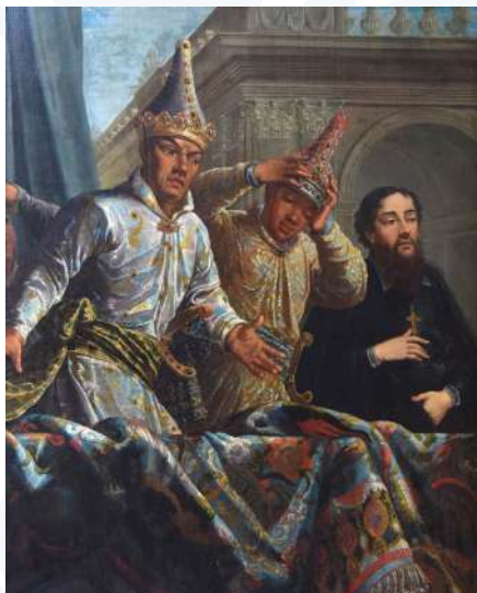
Ambassade du Siam et le père Artus de Lionne.

Le 22 décembre de la même année, la délégation française réembarque vers la France, conduisant avec elle,