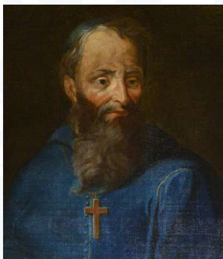
Portrait de Mgr Lambert de la Motte.