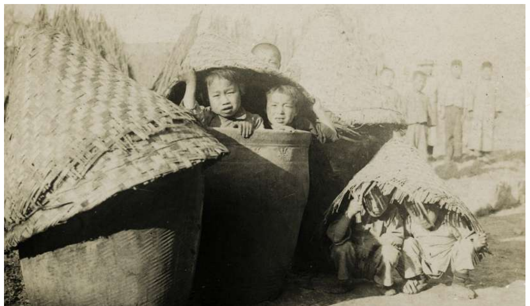
Les urnes d'Ali Baba, Chantchouang Tse, Chine, IRFA