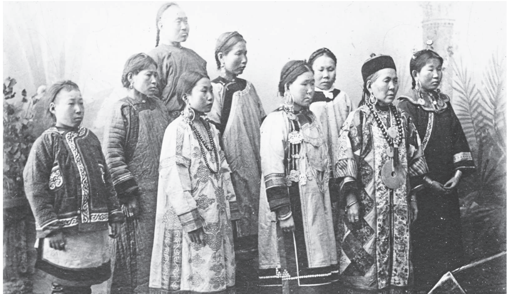
Golde à Khabarovka, BnF.