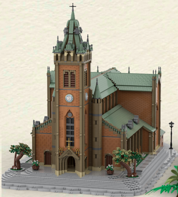
Modélisation de la cathédrale de Myeongdong à Séoul 103 x 60 x 67 cm 16 333 briques