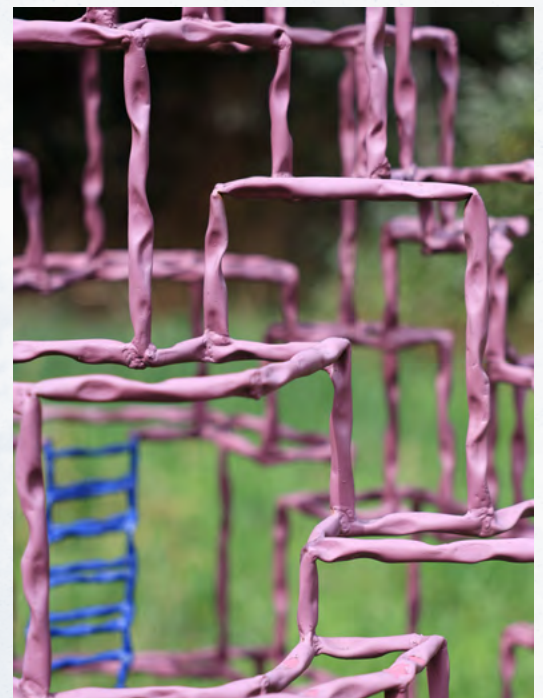
Promenade, 2020, tuyau de fer peint / Détail.