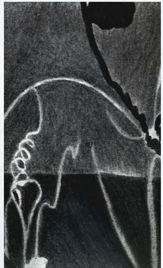
Mur et Fleur, 2026, Fusain sur papier, 17 x 12cm / Détail. © Zion