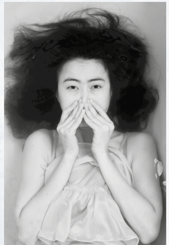
Se libérer de la peur, 2014, Autoportrait, photographie, 100 x 75 cm.