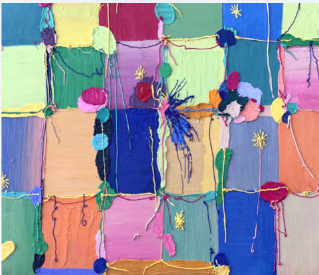
L'interstice, Mur et Fleur, 2025, huile sur toile, 60 x 80cm / Détail. © Zion