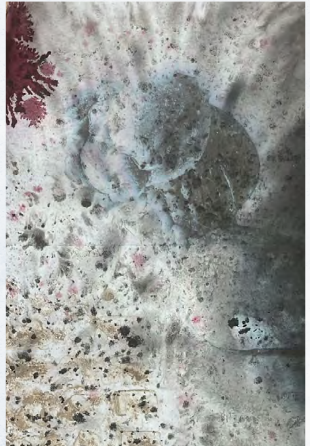
Sans titre 2, 2026, encre sur papier, 21 x 29,7 cm. © Luca Chen