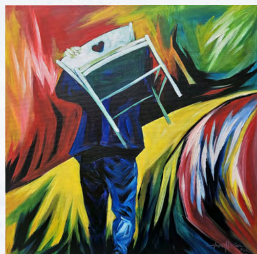
Carrying my own space within me, 2026, acrylique sur toile, 50 x 50 cm. © Thoe Htein