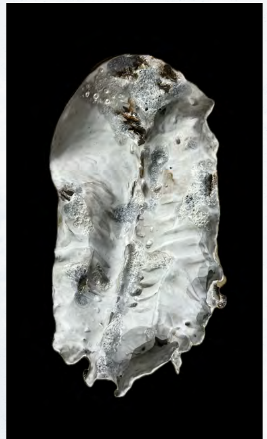
Anodos, 2025, céramique, 53 x 27 x 5,5 cm. © Aung Ko